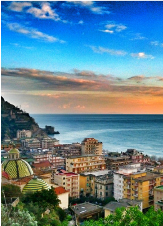
Sant'Angelo, distrutta dai Pisani nel 1137.

L'arte dell' ospitalità ed il sorriso sono tra le principali peculiarità degli abitanti della Costiera Amalfitana e di Maiori, lembo di terra baciato dal sole e accarezzato dal mare .