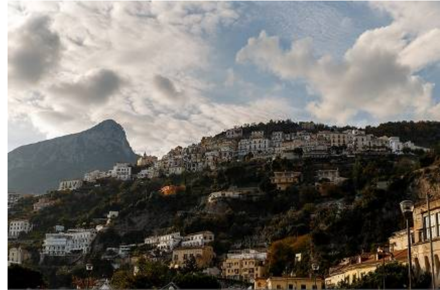
Tutto il territorio cittadino, solcato dal fiume Bonea,

L'insieme delle bellezze paesaggistiche, architettoniche e culturali, di valore inestimabile e di impareggiabile magnificenza, hanno fatto sì che Vietri, insieme agli altri splendidi scenari della costiera amalfitana, venisse dichiarata dall'UNESCO Patrimonio Mondiale dell'Umanità dal 1997.