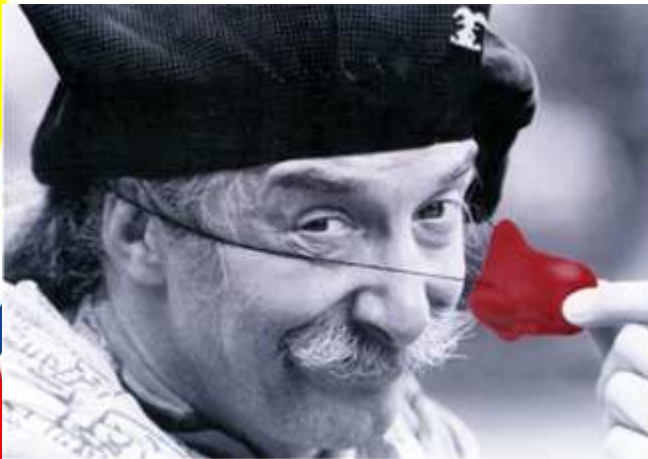
(Hunter "Patch" Adams)