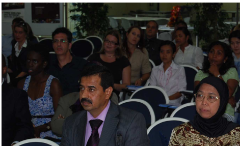
Partecipanti al 5° Corso sul Diritto delle Migrazioni

L' Istituto ha organizzato, in collaborazione con l'Organizzazione Internazionale per le Migrazioni (OIM), il 5° Corso sul diritto internazionale delle Migrazioni, svoltosi dal 28 settembre al 2 ottobre 2009. Hanno partecipato 54 funzionari governativi, esperti, rappresentanti di Organizzazioni internazionali e non-governative, membri della società civile provenienti da circa 25 differenti paesi.