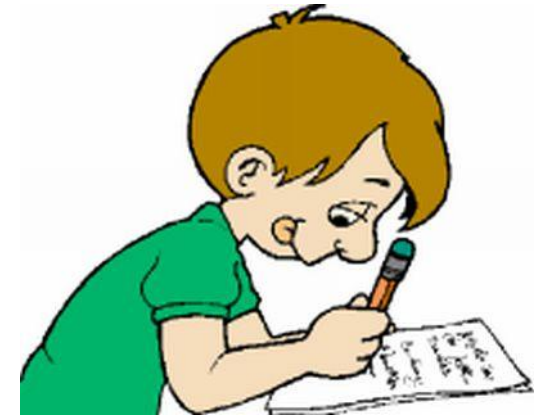
Studenti di scuole ogni ordine e grado