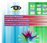
A.R.I.S. di Palermo