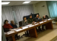
Garante siciliano della persona disabile

Al Civico di Palermo l'U.O. di Radiologia attiva fino a mezzanotte e visite pomeridiane al reparto di Cardiologia Pediatrica.