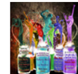
A.I.L. di Palermo