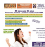
S.A.P. di Priolo Gargallo