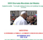
A.C.O.S. di Palermo