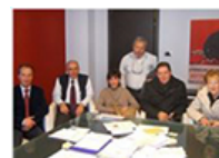
Rete Reumatologica Siciliana