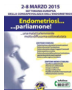
A.I.E. di Messina