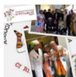
Ci ridiamo su di Ragusa