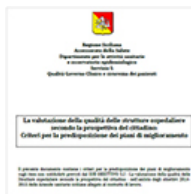
Ricerca Corrente 2012

Sono state diramate le Linee Guida per l'attuazione dell'Atto d'indirizzo assessoriale per lo sviluppo della Rete Civica della Salute (RCS) in Sicilia ...leggi tutto