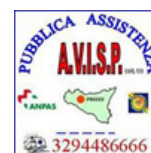
A.V.I.S.P. di Prizzi