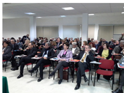
Reclutamento Riferimenti Civici della