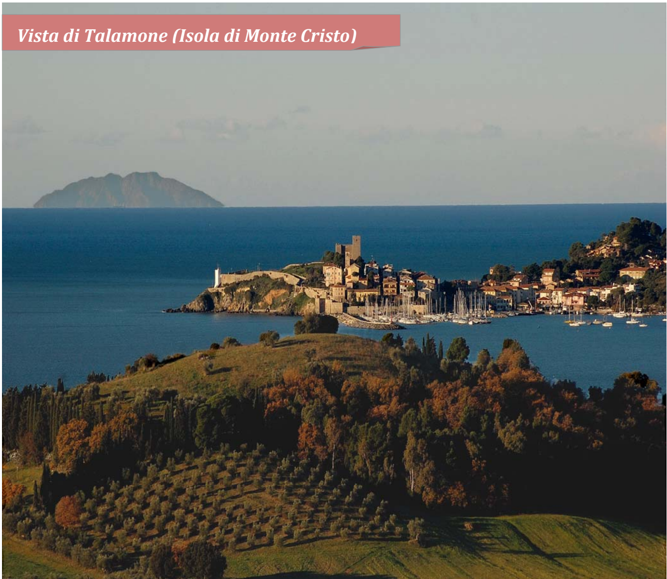
Vista di Talamone (Isola di Monte Cristo)

Durante i momenti di libertà potrete visitare una zona ricca dal punto di vista archeologico e ambientale. Si passa dalle splendide acque e fondali del Promontorio dell'Argentario circondato dalle Isole dell'Arcipelago Toscano quali, ad esempio, Giannutri e Giglio ( Diving convenzionato), alla famosa oasi WWF di Orbetello, ai siti Etruschi e Romani di Saturnia e della città di Cosa (200 a.c.). Molto interessanti da visitare sono i siti spagnoli di Orbetello, Porto Ercole e Porto Santo Stefano, sovrastati da mura e fortezze risalenti ai Real Presidi Spagnoli .