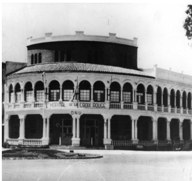
Sede dell'ospedale da campo n° 010 della Croce Rossa Italiana allestito presso l'ex albergo Bellevue di Elisabethville