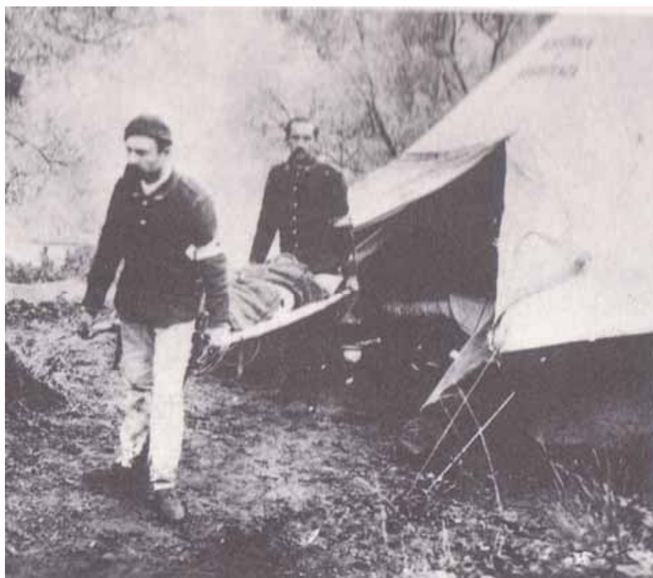
Due militi barellieri trasportano un ferito

L'opera di soccorso ai terremotati fu validamente sostenuta anche dalle Infermiere Volontarie con il loro alto spirito di sacrificio e la loro indiscussa capacità operativa.