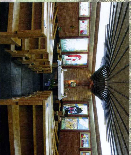
Cappella del Centro

Forte di una lunga tradizione, il nostro Centro di Spiritualità, grazie alla sua struttura polivalente e all'ampio parco di cui dispone è il luogo ideale per tutti coloro che desiderano organizzare in tutta serenità: