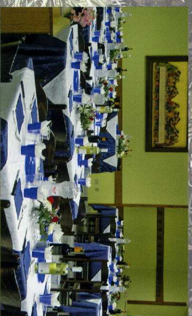
Sala di ristorazione

Abbiamo inoltre la possibilità di accogliere gruppi di pellegrini ed ospiti occasionali.