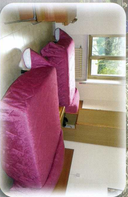
Una delle 62 camere singole o multiple con servizi igienici interni