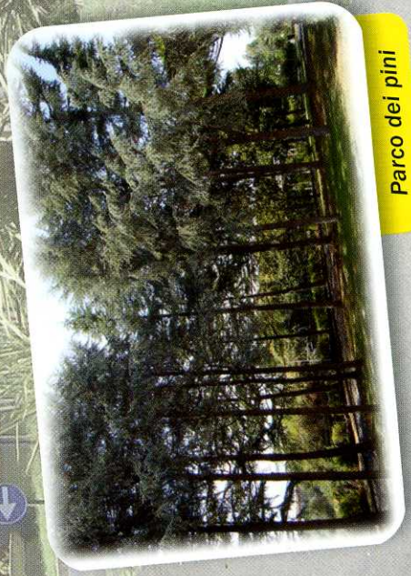
Parco dei pini