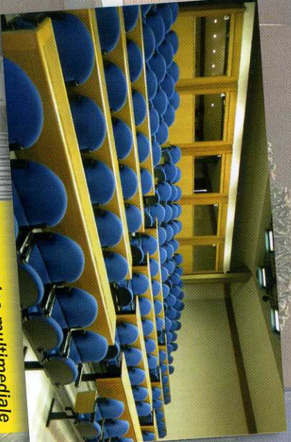
Aula magna multimediale