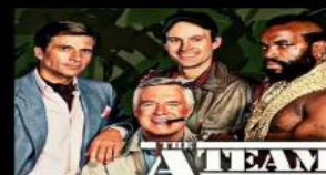
TeamBuilding e Rete tra Volontari