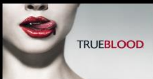
Sensibilizzazione alla Donazione