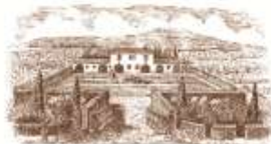
Paesaggio del casale agricolo Casale del Giglio di Torino

Si ringraziano per aver aderito all'evento: