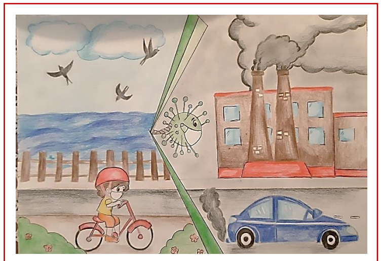
Elaborati vincitori dell'edizione 2020/2021 dei Concorsi.