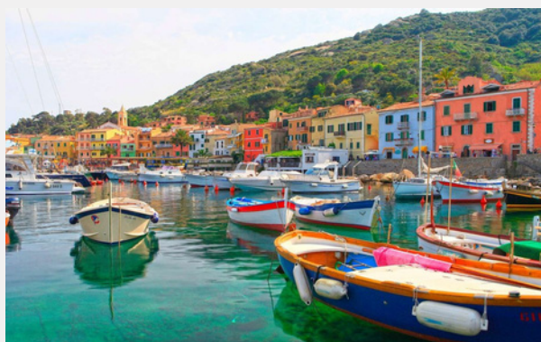
ISOLA DEL GIGLIO