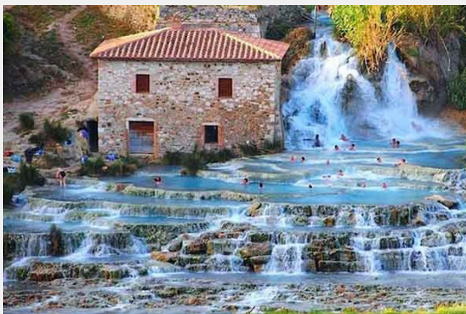
SATURNIA—LE CASCADE DEL MULINO