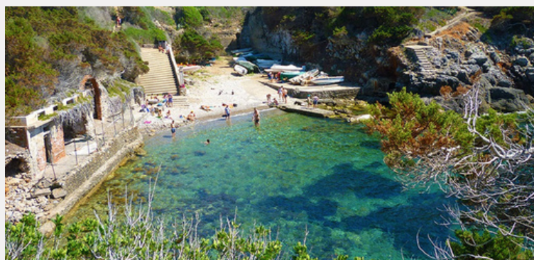
ISOLA DI GIANNUTRI