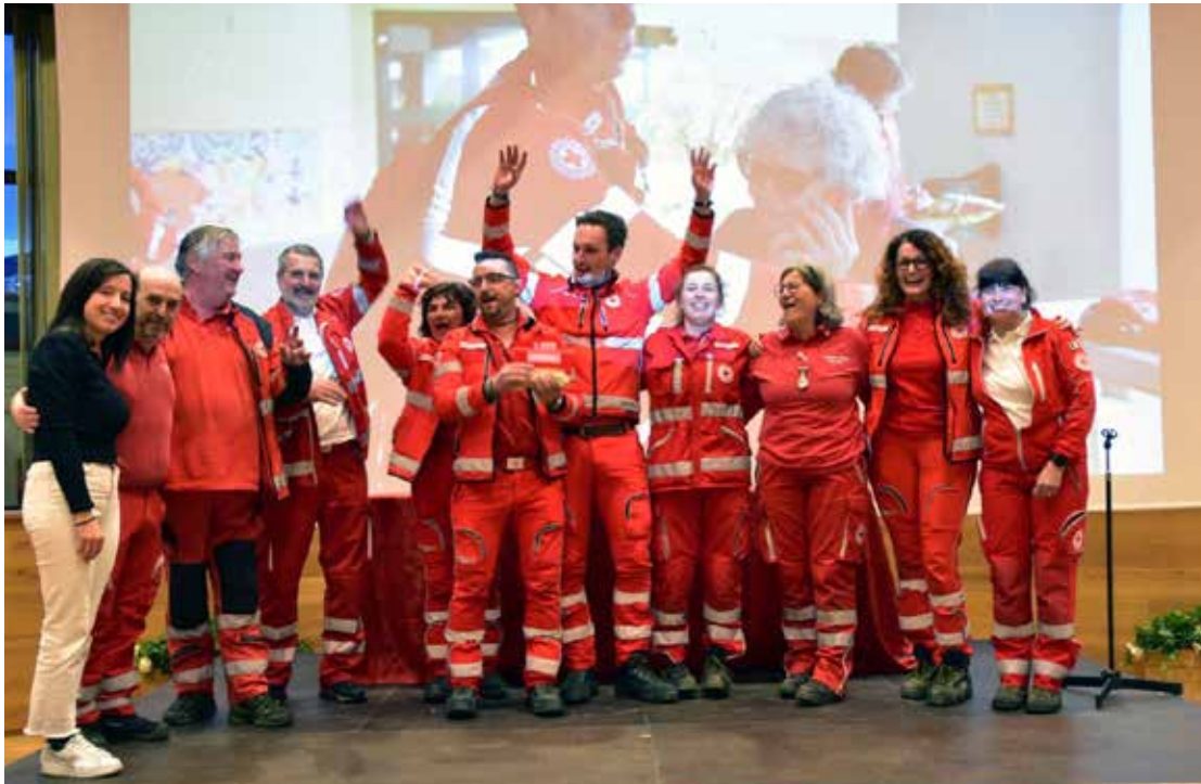
Premiazione 1° squadra della classifica Generale: 'Perzemergency', unità territoriale di Pergine