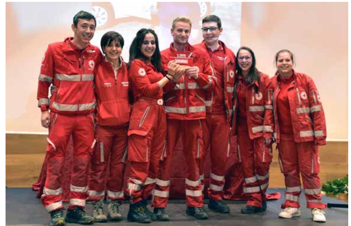
Premiazione 1° squadra classificata nella gara di Manovre salvavita: 'I Lukas' unità territoriale di Rovereto