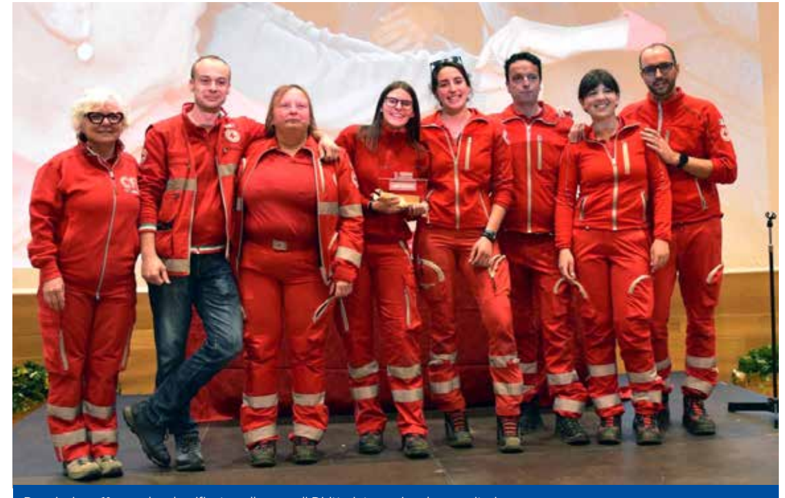
Premiazione 1° squadra classificata nella gara di Diritto internazionale umanitario: 'La mia banda suona il rock' unità territoriale di Moena