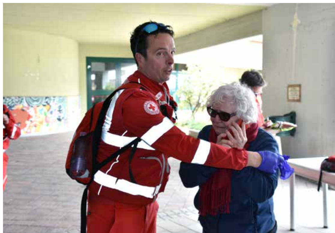
Partecipante con simulatore in scenario di Emergenza di protezione civile

L e gare di primo soccorso fanno parte della storia dell'Associazione e arrivano, quest'anno, alla ventinovesima edizione. La cultura che accompagna questa competizione non è quella di misurare la preparazione dei diversi Comitati italiani, quanto più quello di creare un'occasione di confronto e scambio di buone pratiche di soccorso, mentre le Olimpiadi di Primo Soccorso sono una rivisitazione delle gare, proposta agli istituti scolastici, in collaborazione con il Ministero dell'istruzione. La Croce Rossa del Comitato della Provincia