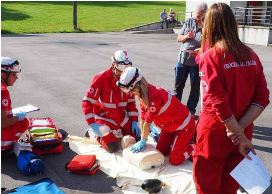
In piena azione durante una prova di Primo Soccorso

*Consigliere Comitato CRI Provincia autonoma di Trento