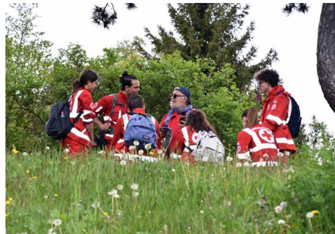
Squadra in pausa durante una gara di Primo Soccorso