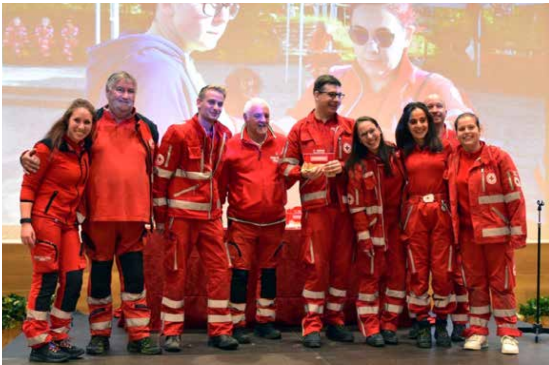
Premiazione 1° squadra classificata nella gara di Emergenza: 'I Lukas' unità territoriale di Rovereto