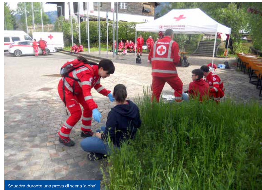
Squadra durante una prova di scena 'alpha'