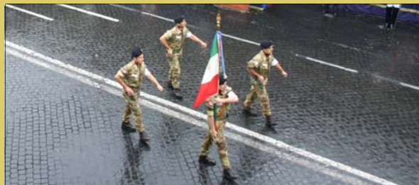
La Bandiera del Corpo Militare CRI è così decorata: