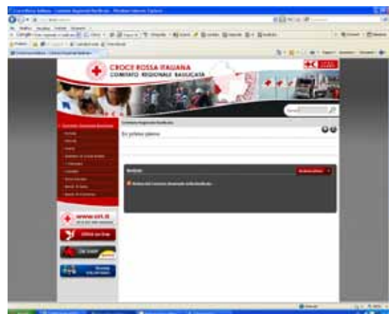
Esempio del passaggio di un sito regionale al nuovo format web