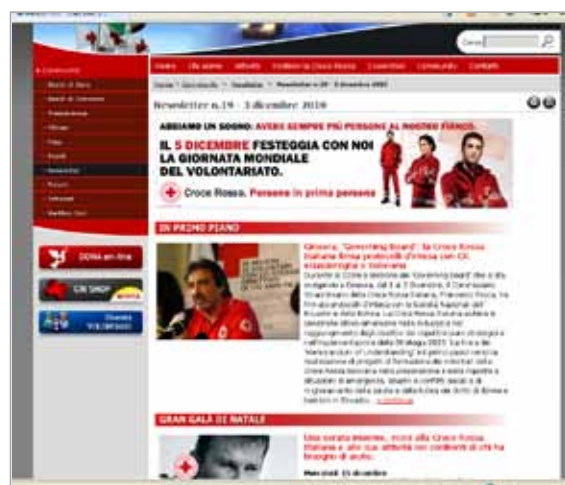
Esempio di Newsletter